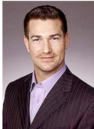
Hart: Creo que otros canales harán algo similar al convenio entre Univisión y YouTube

Sobre los temas aún no revelados del acuerdo, Hart comenta: "Hasta este punto se sabe que es un trato de ganancias convertidas, pareciera que una parte un poco mayor de las ganancias irá a Univisión por ser el proveedor de contenido. Sin embargo, históricamente ha sido YouTube quien ha vendido la publicidad en YouTube. Esto deja abierta la pregunta de si Univisión venderá la publicidad en YouTube. Univisión tiene la fuerza de venta, conoce el mercado, conoce las marcas, pero si vendes en YouTube eso significa que tienes que compartir las ganancias" cierra el ejecutivo.